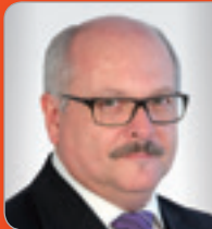
ADir. Szöky Diplom-Rechtspfleger in Firmenbuchsachen Handelsgericht Wien