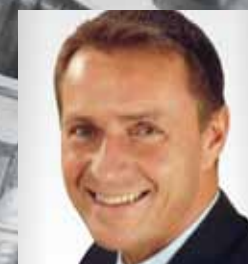
DI HIRSCH Allg. beeid. & gerichtl. zert. SV

inkl. 2. Änderung der Elektro- technikVO 2002