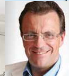
HR Dr. GITSCHHALER Oberster Gerichtshof

15. September 2010, Graz 29. September 2010, Wien 13. Oktober 2010, Innsbr. 15. September 2011, Graz jeweils von 9.00-17.00 Uhr