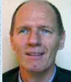
M. WEISS Erste Bank AG