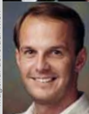
DI ZOWA TÜV Austria Consult GmbH