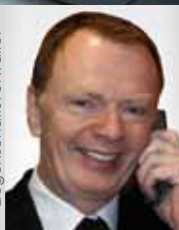
P. NEMETH Allg. beeid. & gerichtl. zert.