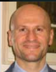
Mag. EPPLY Finanzverwaltung