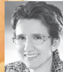
Dr. ZELLER PRISMA Kreditversicherungs-AG

Absicherung und Durchsetzung von Ansprüchen