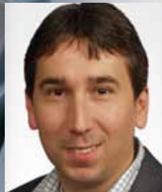
Mag. KRAFT Steuer & Service GmbH

16. Sept. 2010, Rust 28. Sept. 2010, Salzburg 20. Okt. 2010, Feldkirch 21. Okt. 2010, Innsbruck 18. Nov. 2010, Wien