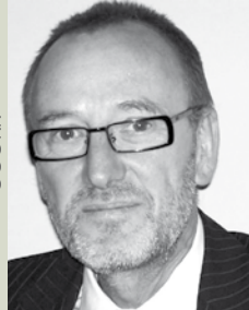
RR ADiR. HOFBAUER Bw. FB d. Finanzverwaltung