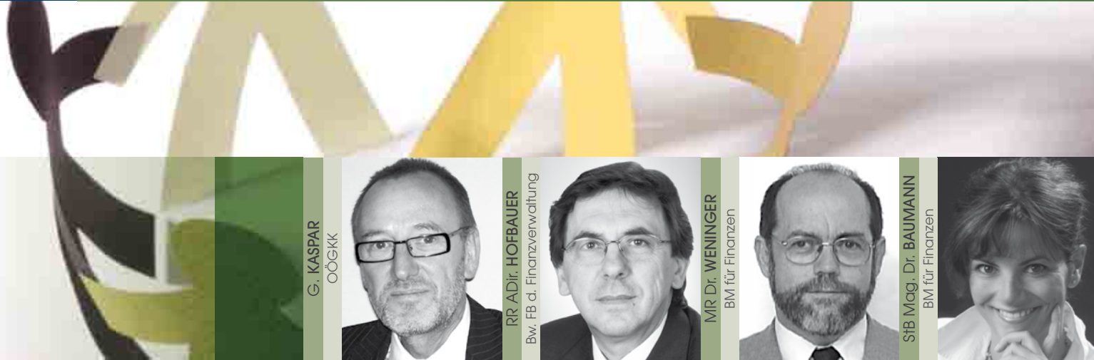
G. KASPAR OÖGKK