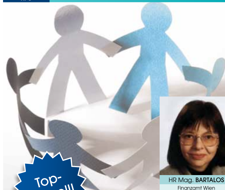
HR Mag. BARTALOS Finanzamt Wien