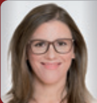
RA Dr. Körber-Risak Arbeitsrechts- expertin KÖRBER-RISAK RA GmbH