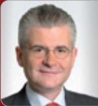
RA Mag. Brogyányi Partner Dorda Rechts- anwälte GmbH