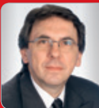
RR ADir. Hofbauer Lohnsteuer- Experte ehem. BMF