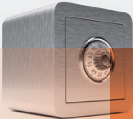
Univ.-Prof. Dr. BOLLENBERGER DSC Doralt Seist Csoklich RAe-GmbH