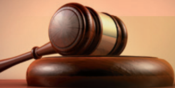
RA Dr. POCK Estermann Pock RAe GmbH