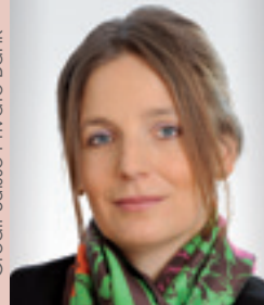
Mag. KÖNIG Flick Privatstiftung