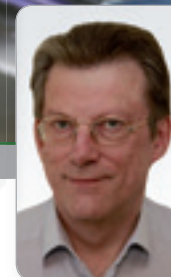
Dr. Tews Rechtsanwalt Familienrechts- Experte