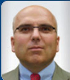
StB Mag. Portele Geschäftsführer Selbst. Steuer- berater